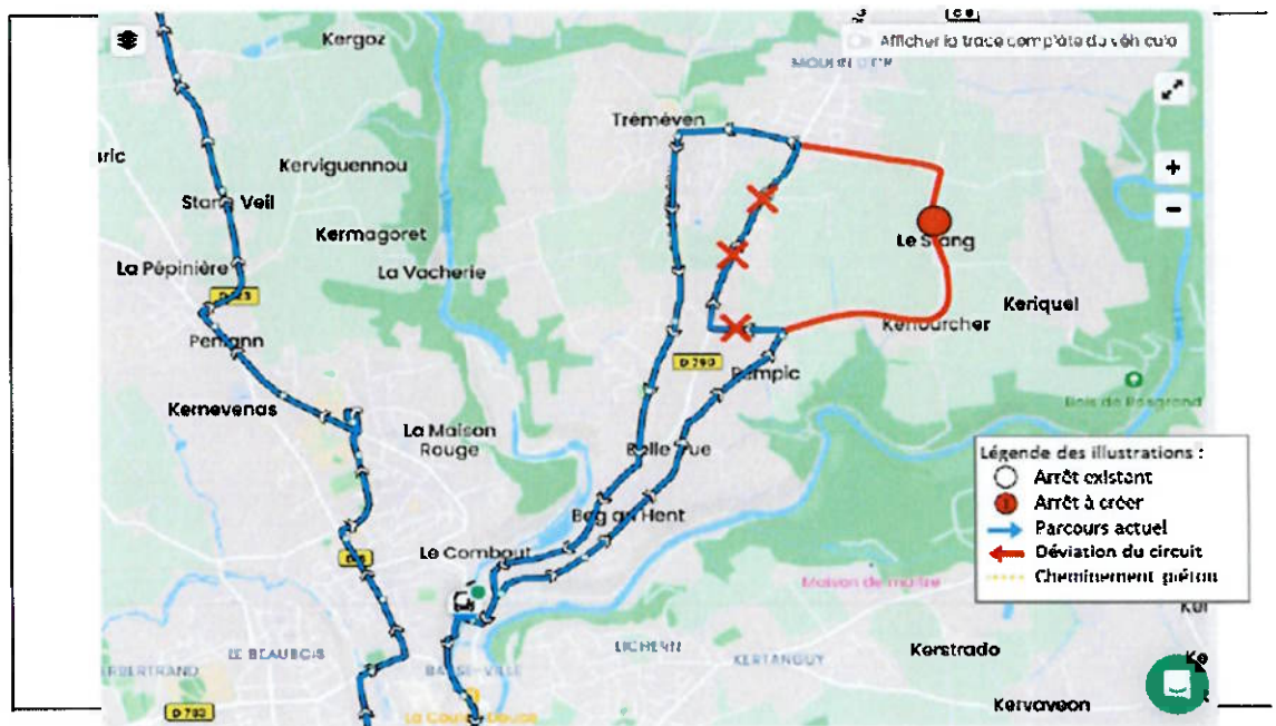
Schéma desserte :

A la demande de plusieurs familles, un nouvel arrêt va être installé pour la rentrée prochaine au lieu-dit Le Stang :